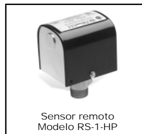
Sensor remoto Modelo RS-1-HP